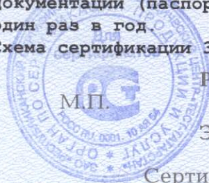
Схема сертификации 3.

Место нанесения знака соответствия - на упаковке, в товаросопроводительной документации (паспорт качества) Периодичность проведения инспекционного контроля - один раз в год.